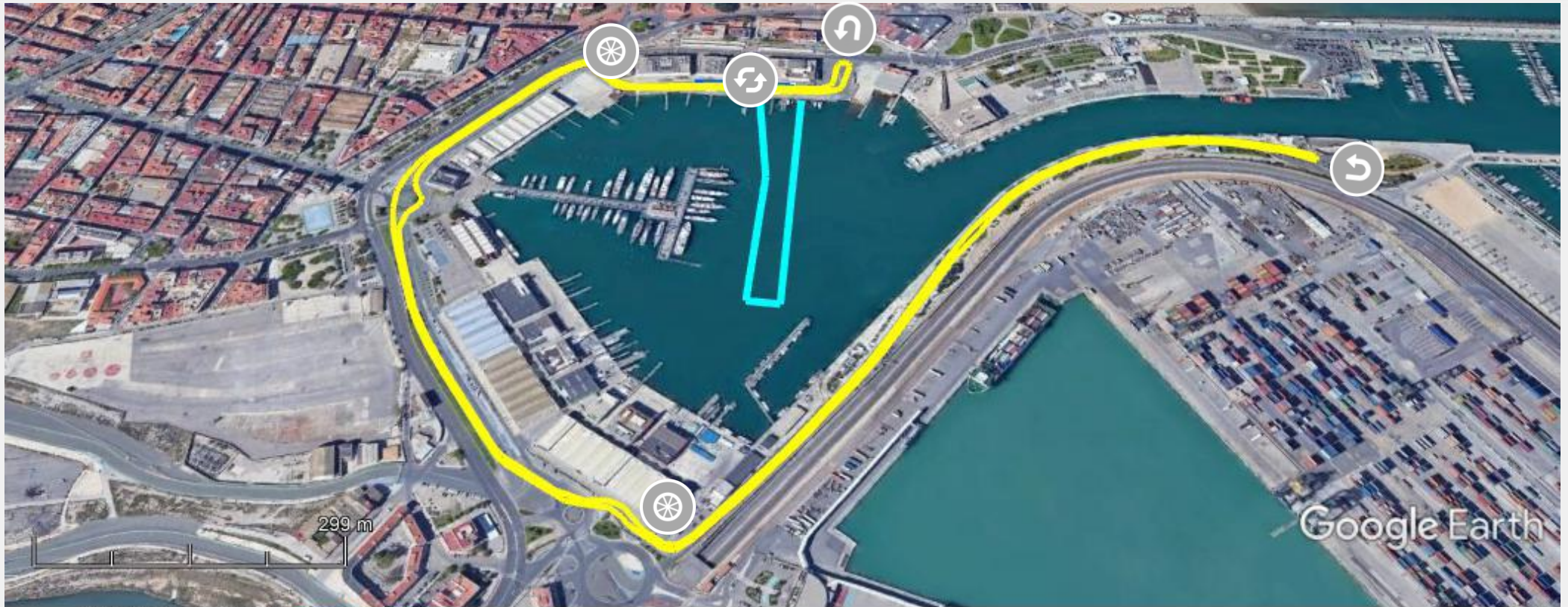
Gráfico: min., media, máx. Elevación: 0, 2, 3 m Total de intervalo: Distancia: 4.86 km Incremento/pérdida de elevación: 44.6 m, -44.6 m Pendiente máxima: 12.2%, -12.7% Pendiente media: 1.3%, -1.3%