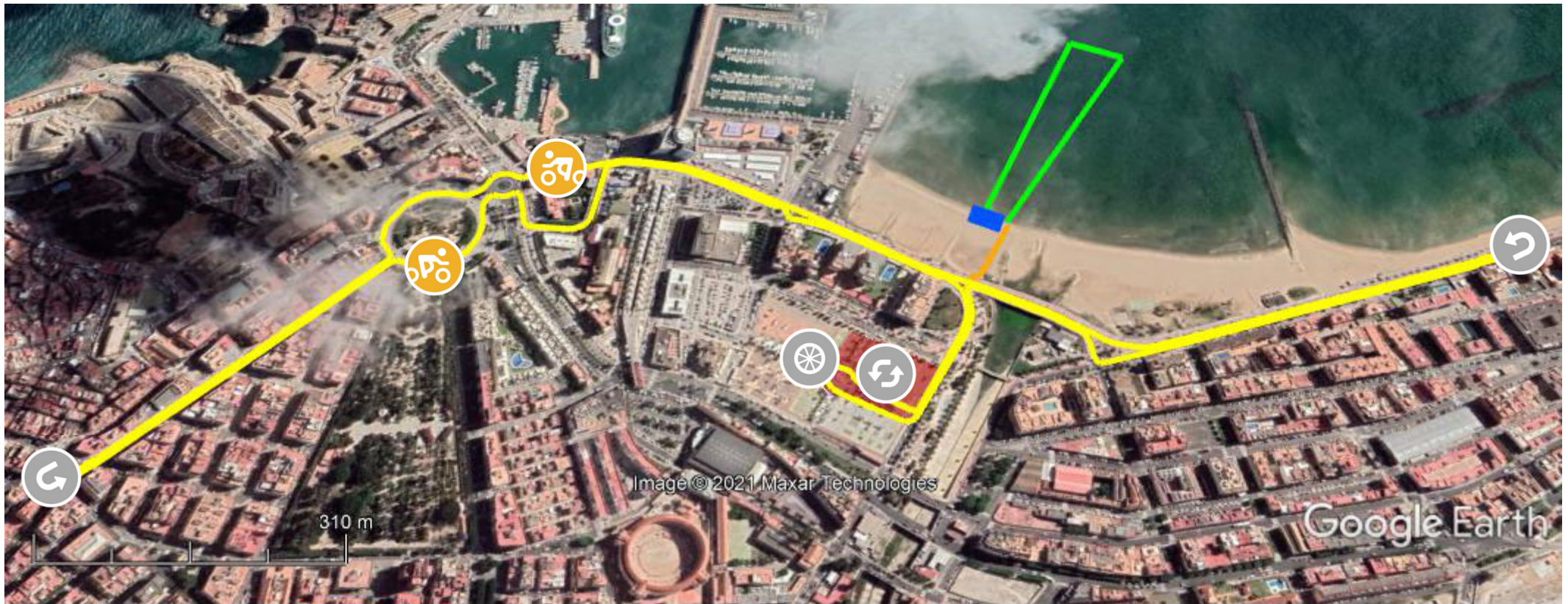
Gráfico: min.. media, máx. Elevación: 1, 3, 8 m Total de intervalo: Distancia: 4.64 km Incremento/pérdida de elevación: 32 m, -32.2 m Pendiente máxima: 9.0%, -7.9% Pendiente media: 1.1%, -1.1%