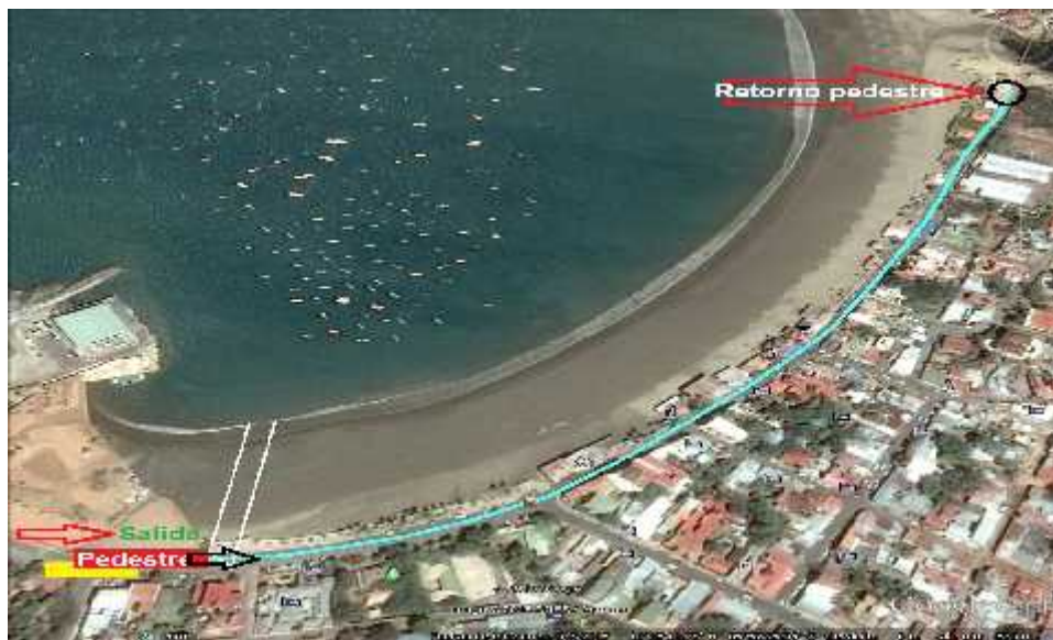
Imagen de Distancia Olímpica Atletismo: