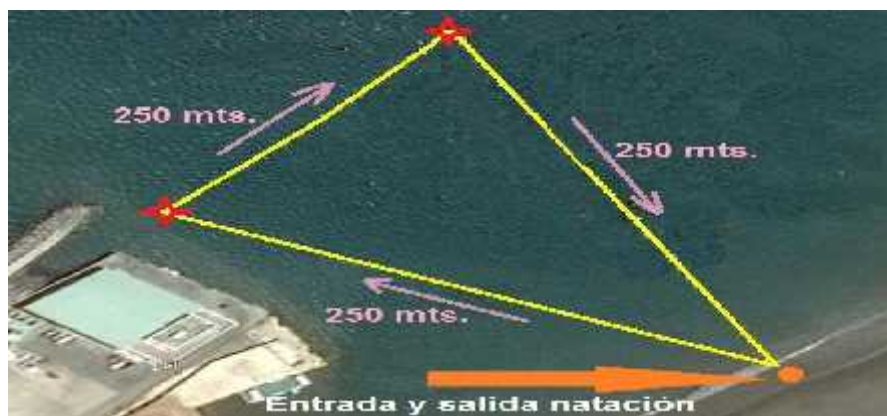
Imagen de Distancia Olímpica Natación:

Atletismo: Se realiza en la ciudad de San Juan del Sur.